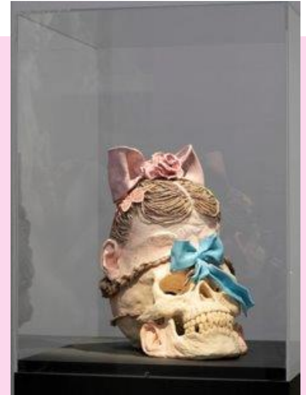
Stiina Saaristo Hybridi ranskalaisilla leteillä , 2020