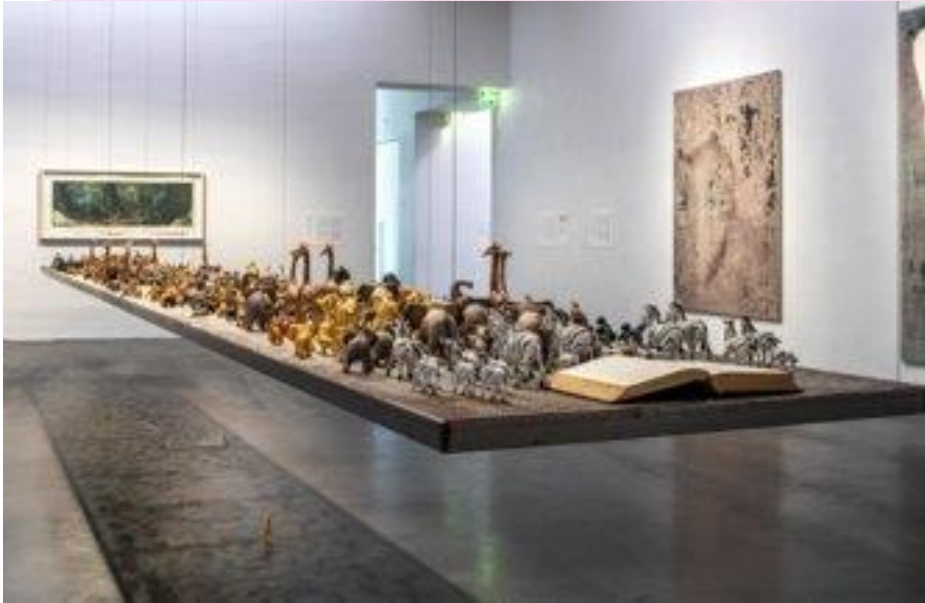
Maaria Wirkkala Found a Mental Connection 2 , 1998