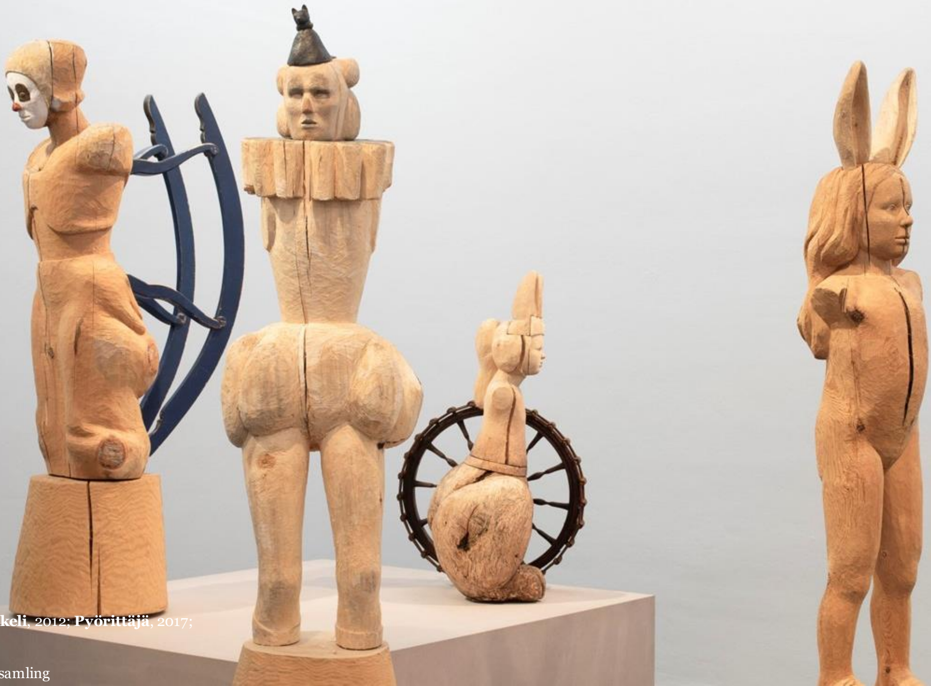
Mia Hamari Klovni, 2013; Enkeli, 2012; Pyörittäjä, 2017; Jänistyttö, 2016