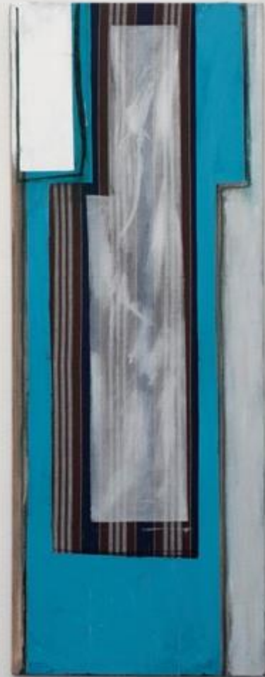
Juhani Tuominen II Mavi türbe / Sininen türbe II; Yeşil ışık / Vihreä valo, 1997